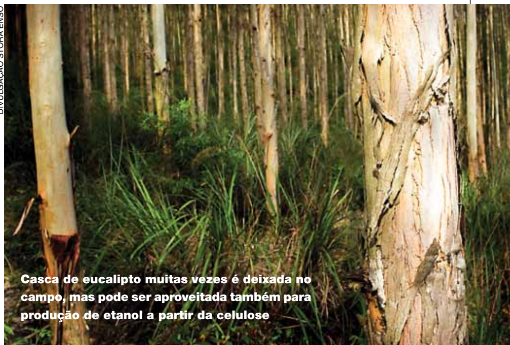
Casca de eucalipto muitas vezes é deixada no campo, mas pode ser aproveitada também para produção de etanol a partir da celulose

mesma produção por hectare em um ano, e essa curta rotação é importante para que investidores tenham retorno rápido”, diz.