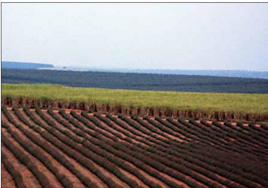
Em Lins (SP): ao fundo, eucaliptal mais velho e, no centro, cana de açúcar. Mais próximo, eucalipto clonal adensado para produção de biomassa