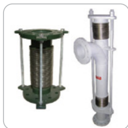
Metálicas tipo fole em aço inox