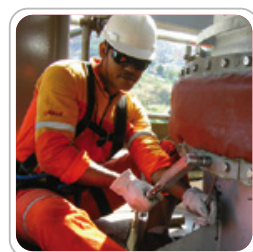
Serviços de montagem e reparo