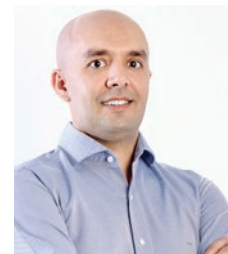
DIVULGAÇÃO: ASSOCIAÇÃO LATINO-AMERICANA DE COACHING

PRESIDENTE DA SOCIEDADE LATINO-AMERICANA DE COACHING (SLAC) E ESPECIALISTA EM COMPORTAMENTO HUMANO. ✉: assessoria@slacoaching.org