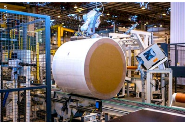
As vendas de celulose da Unidade Puma, da Klabin, atingiram 399 mil toneladas, crescimento de 10% na comparação com o 4T17, sendo 299 mil toneladas de fibra curta e 100 mil toneladas de fibra longa e fluff

“A International Paper apresentou ganhos e retornos muito fortes no quarto trimestre e no ano de 2018, impulsionada pelo sólido de-