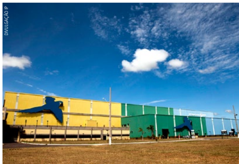
A International Paper informou que os resultados líquidos do quarto trimestre de 2018 atribuíveis à empresa totalizaram US$ 316 milhões em comparação aos resultados líquidos de US$ 562 milhões registrados no terceiro trimestre de 2018 e os resultados líquidos US$ 1,5 bilhão apresentados no quarto trimestre de 2017

A receita líquida da Klabin no 4T18 aumentou 21% em relação ao mesmo período de 2017, alcançando R$ 2,78 milhões. A companhia ressalta o aumento de 52% na receita do mercado de celulose, que atingiu R$ 1,10 milhão, e o crescimento de 39% no mercado de kraftliner, que registraram maior volume de vendas além da melhora de preços. Na comparação anual, a Klabin registrou 9% de aumento na receita líquida da sua unidade de negócio de papéis e 7% em embalagens.