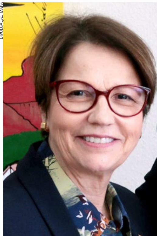
Ao considerar a relevância do agronegócio à economia brasileira, a ministra Tereza Cristina frisa que a adoção do autocontrole por parte do setor privado é uma das prioridades do Mapa

À frente do Ministério da Agricultura, Pecuária e Abastecimento (Mapa), a ministra Tereza Cristina garante que as portas estão abertas para o diálogo franco com todos os segmentos. “Tenho recebido meus colegas parlamentares, tratado com ministros, secretários, membros do setor privado, cooperativas e movimentos sociais. Quem tem assunto relacionado ao nosso dia a dia está sendo ouvido, sem restrições. Meu objetivo é um só: destravar as ações e fazer uma gestão ágil, que ajude a avançar ainda mais o agronegócio, uma atividade que tem sido fundamental para a recuperação econômica do nosso País”, afirma a ministra.