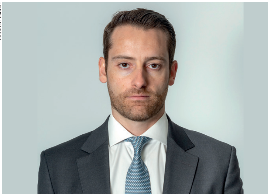
A atual recuperação do preço da celulose é apoiada por uma série de fatores, segundo explicação de Lofiego: “a recuperação da demanda na Europa e a forte demanda contínua na China e na América do Norte estão entre eles”