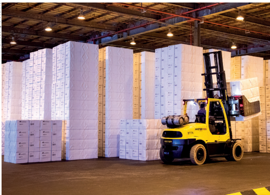
Os players nacionais do segmento de celulose devem se beneficiar ao máximo com o ciclo de alta da celulose em 2021, enquanto as tendências operacionais continuam positivas, com a utilização da capacidade de volta aos níveis normais