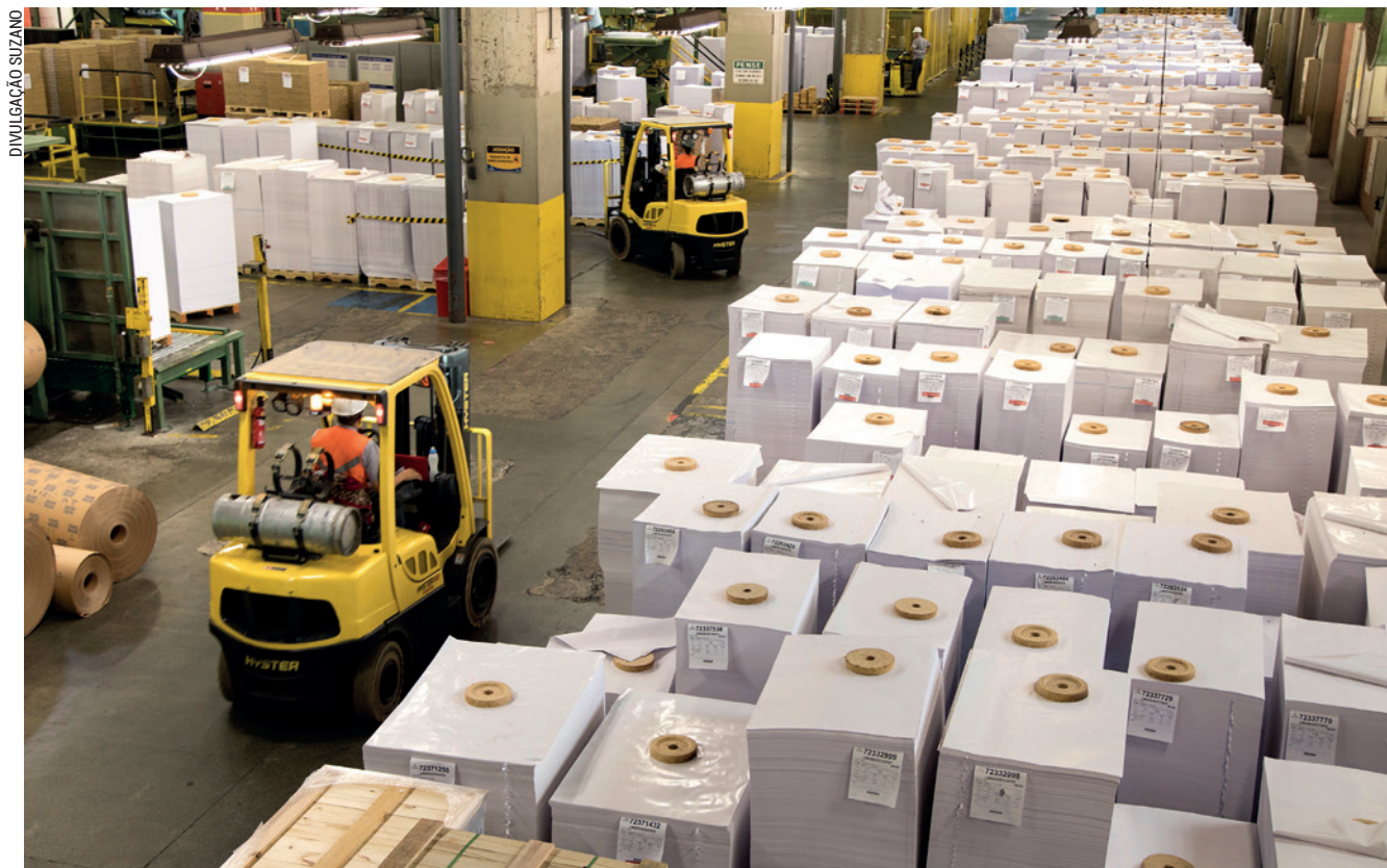
O câmbio ajudou muito nas exportações dos segmentos de papéis, principalmente em áreas como os papéis de I&E, cujas vendas externas atenuaram a crise vivida no mercado doméstico

Conforme o balanço feito por Barisauskas, mais do que nunca, fez-se necessário entender as dinâmicas de oferta, demanda e fluxos de comer-