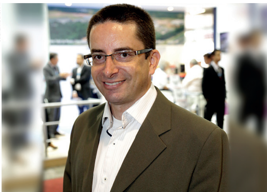
Funchal: “O segmento de papelcartão tem sido altamente demandado a apresentar embalagens mais resistentes e especializadas – o que é ótimo, pois demonstra que foi escolhido por outros setores industriais como diferencial positivo para estratégias futuras”