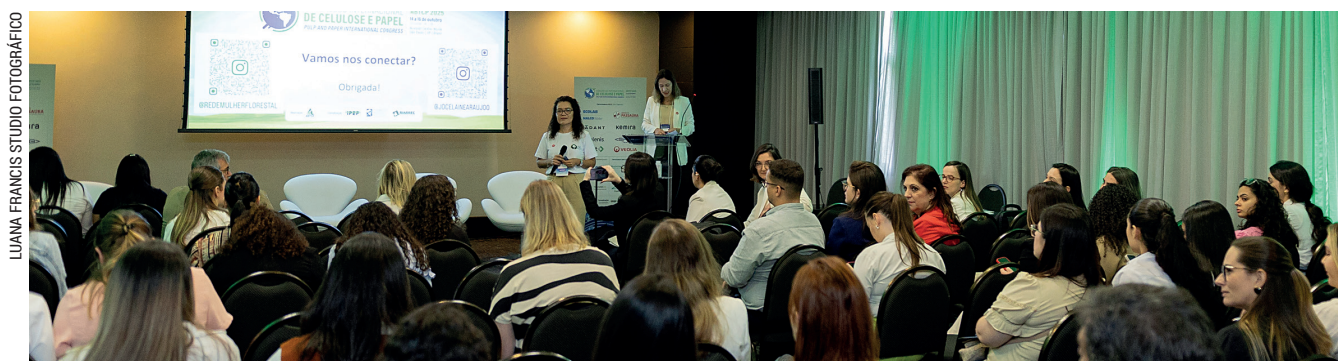
LUANA FRANCIS STUDIO FOTOGRAFICO